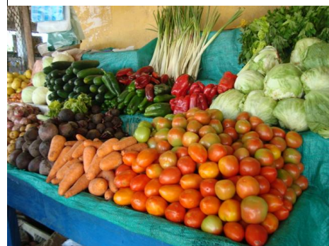
Im Zentrum auf dem Markt