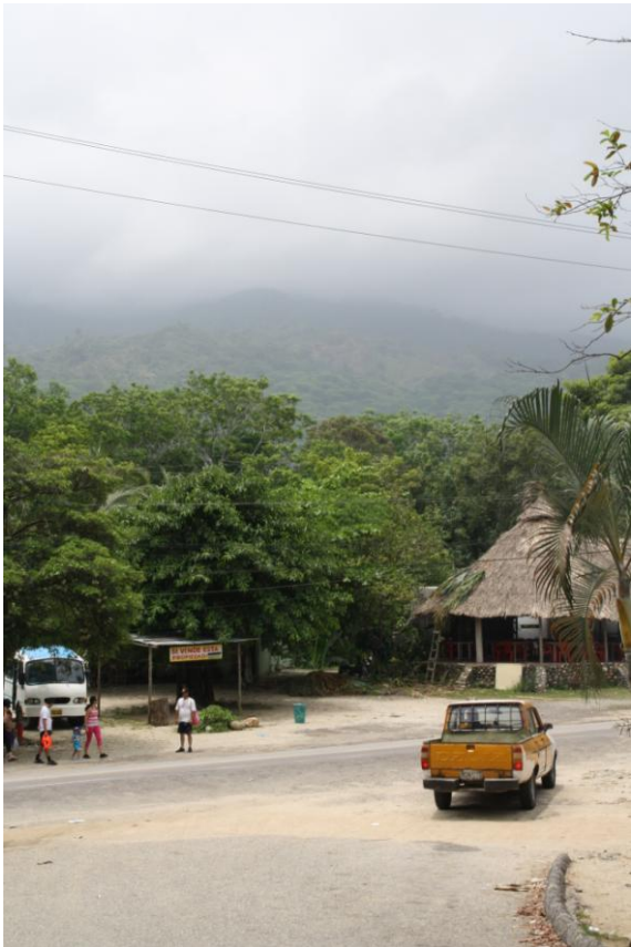
In den Bergen