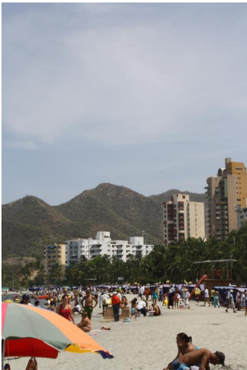
Am Strand von Santa Marta