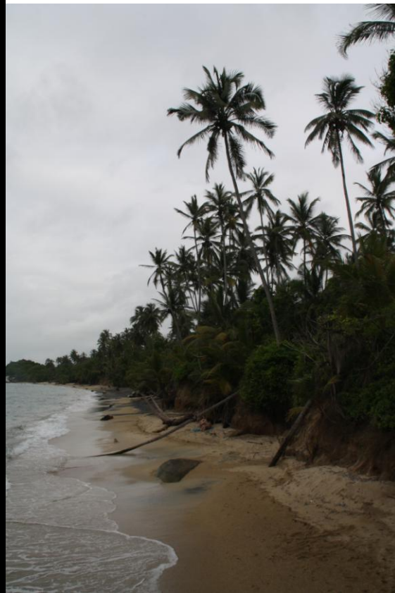
An einem der vielen Strände